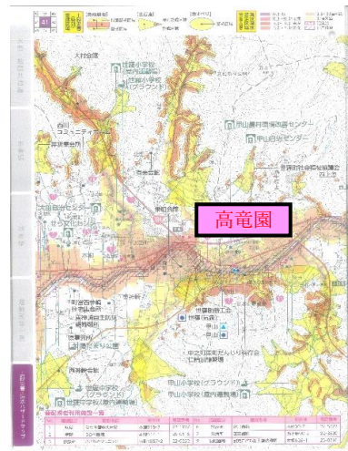
世羅町土木災害・洪水ハザードマップ <甲山地区> 近隣抜粋