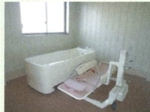
歩行が困難な方は横になった状態で安心してご入浴いただけます