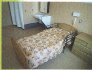
個室には全室洗面台を設置しております