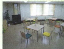
新館1階のホールは一般の方にもご利用いただけます