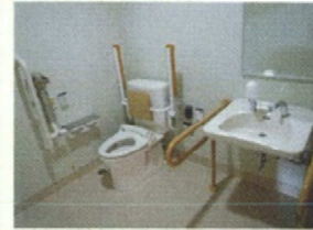
背もたれや介助バーが付いているので安心してご利用いただけます