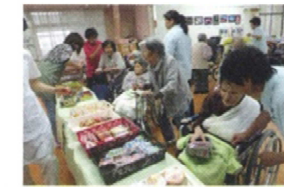
おやつバイキング