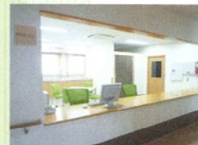
居室と食堂の間にあるケアステーション。ご用事があればお気軽にお声がけ下さい