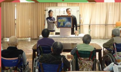
はぐるま座様による紙芝居