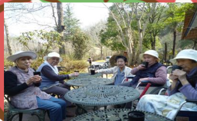
ドライブ (絵麗顔都)